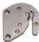
Нож в корпусе из нерж. стали