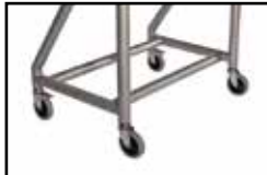
Messer mit Edelstahlhalterung Untergestell