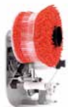
Sistema de llaços