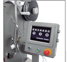
Accesorio de Clip en carrete para altas producciones.