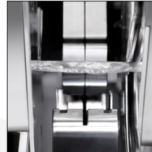
Máquina con separadores que permite producir con la cola limpia.