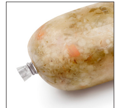
Cola del embutido completamente exenta de producto.